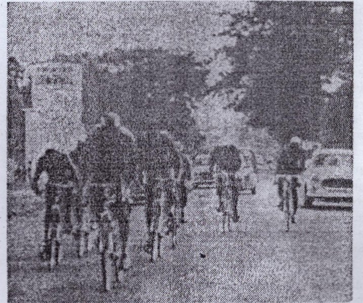
Une phase de la course du jeudi après-midi.